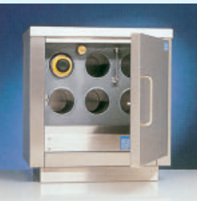
Kruikenmoeder zonder opbergruimte

De kruikenmoeders zijn vanzelfsprekend solide en uiterst veilig. De binnenketel is gemaakt van roodkoper, terwijl de buitenbeplating geheel uit roestvrijstaal bestaat. De verwarming geschiedt door een elektrisch dompel-element, de temperatuur wordt thermostatisch geregeld. Standaard voorzien van een droogkookbeveiliging. Op het front van de binnenketel is een peilglas aangebracht waarop het waterniveau is af te lezen. Bijvullen geschiedt door een vulopening op het ketel-front. Kruikenmoeders zijn leverbaar in vrijstaande-, hangende-of inbouwuitvoering.