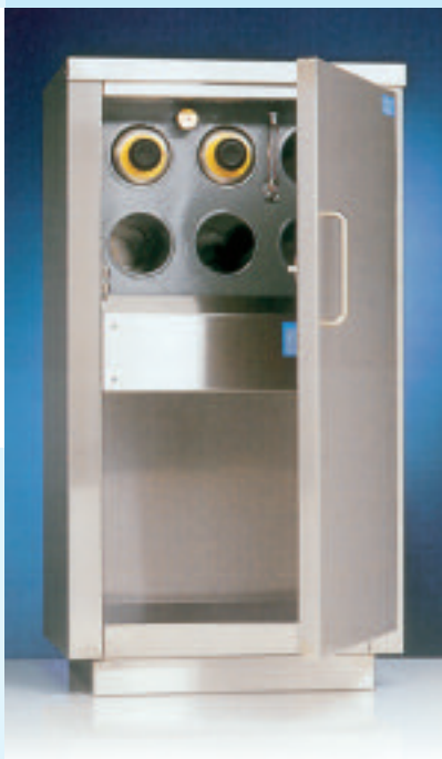
Kruikenmoeder met opbergruimte

De kruikenmoeders zijn vanzelfsprekend solide en uiterst veilig. De binnenketel is gemaakt van roodkoper, terwijl de buitenbeplating geheel uit roestvrijstaal bestaat. De verwarming geschiedt door een elektrisch dompel-element, de temperatuur wordt thermostatisch geregeld. Standaard voorzien van een droogkookbeveiliging. Op het front van de binnenketel is een peilglas aangebracht waarop het waterniveau is af te lezen. Bijvullen geschiedt door een vulopening op het ketel-front. Kruikenmoeders zijn leverbaar in vrijstaande-, hangende-of inbouwuitvoering.